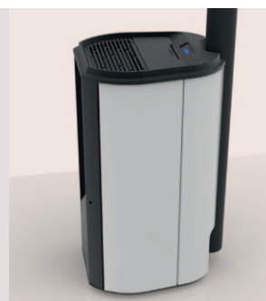
Intégration du conduit