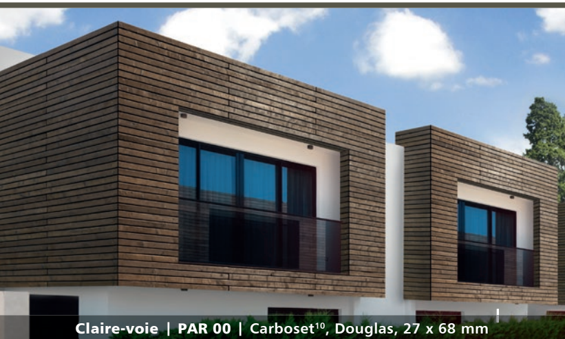
Claire-voie | PAR 00 | Carboaset 10 , Douglas, 27 x 68 mm