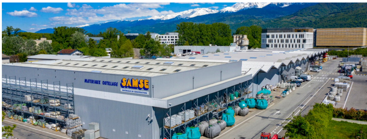
Rénovation et transformation de notre agence emblématique de Saint Martin d'Hères